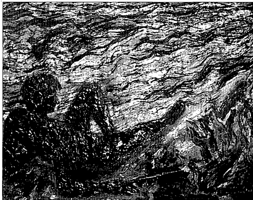
«Le Feu sur la Plage», de Miquel Barceló

«Tres manchas sobre fondo gris», pintado en 1957 por Tàpies (curiosamente el año en que nació Barceló) es una de las obras que componían la serie «Wall» (muro), pintada por el artista catalán en los duros años de la posguerra. La importancia de los muros y las paredes en la imaginería occidental desde los años 30 ha actuado como una metáfora para el espiri-